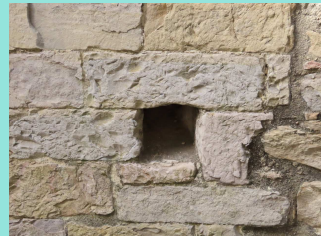
Ci-dessus, un trou de boulins visible dans l'élévation sud et ci-dessous vue sur le chœur voûté en cul-de-four.

En 1663, les commissaires autorisent la permanence du culte protestant à Langlade en raison d'une population majoritairement protestante. L'usage de l'ancienne église comme temple est confirmé lors de la visite de l'évêque Séguier en 1674.